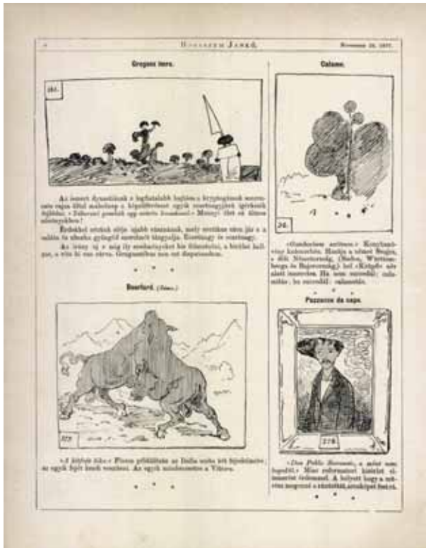
3. A Műcsarnok palotaavatató tárlatának karikatúrái Borsszem Jankó , 10. 1877. november 25. 47. sz. 6.

A külföldiek között már ekkor is a franciáknak volt a legnagyobb presztízszük. Huszonkét festmény érkezett Párizsból, és ami igencsak imponáló, voltak közöttük nagy nevek is: Eugène Delacroix, Jean-Baptiste-Camille Corot, valamint a barbizoni festők mellett kortárs hivatalos nagyságok, mint William-Adolphe Bouguereau ( Pietà ) és Ernest Meissonier ( Az erkély alatt ) is szerepeltek a listán. Budapesten ennyi francia képet látni ritkaság volt és nagy öröm. Ha a kulisszák mögé pillantunk, akkor ez mégsem a szoros magyar–francia kulturális kapcsolatok gyümölcse volt, hanem egy, akkor Párizsban élő huszonegy éves magyar festő, Paczka Ferenc (1856–1925) 9 Léon