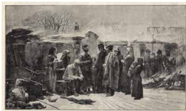
8. Feszty Árpád: Kárvallottak , 1886 Vasárnapi Ujság , 34. 1887. január 23. 4. sz. 60.

A jubileumi kiállításon a külföldi festők aránya már kisebb volt, mint a magyaroké, közöttük a német mű-