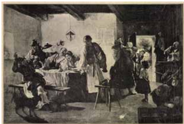
7. Koroknyai Ottó: A javíthatatlan , 1886 Ország-Világ , 7. 1886. november 27. 48. sz. 786.