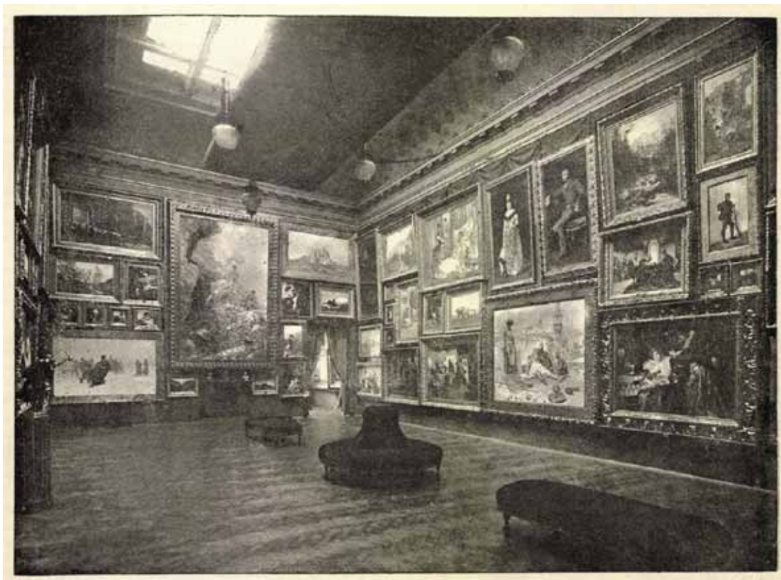
5. A Múcsarnok nagyterme az Országos Magyar Képzőművészeti Társulat jubiláris tárlatán Vasárnapi Ujság , 33. 1886. november 14. 46. sz. 737.

Alexandre Calame romantikus festményét a Vierwaldstätti-tóról mindegyik cikk dicsérte.