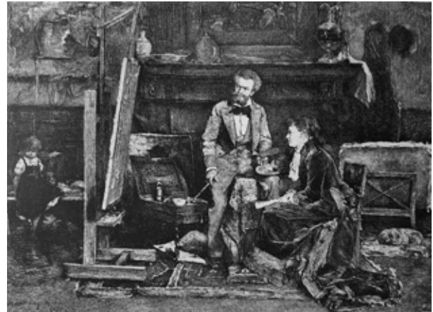
4. Munkácsy Mihály: Műteremben , 1877 SZANA Tamás: Magyar művészek . Budapest, Franklin-Társulat nyomdája, 1887. 24.

Tedesco műkereskedővel való jó kapcsolatának az eredménye. 10 Léon Tedesco valószínűleg raktárkészlete egy részét szállította Pestre, ahová személyesen is eljött. A semmitmondó címek alapján ma már nehéz beazonosítani a kiállított francia képeket, de az összbenyomást illetően a Borsszem Jankó segít (1. kép). 11 A kiállított festmények nagy része igen kis méretű, és így könnyen szállítható volt. A pesti látogatással és kiállítással Tedesco valószínűleg megtalálta a számítását, mert a képek egy részét eladta, 12 és örömeiben a közvetítő Paczka Ferenc egyik festményét ( Rossz hírek ) nagylelkűen a Nemzeti Múzeumnak ajándékozta (2. kép).