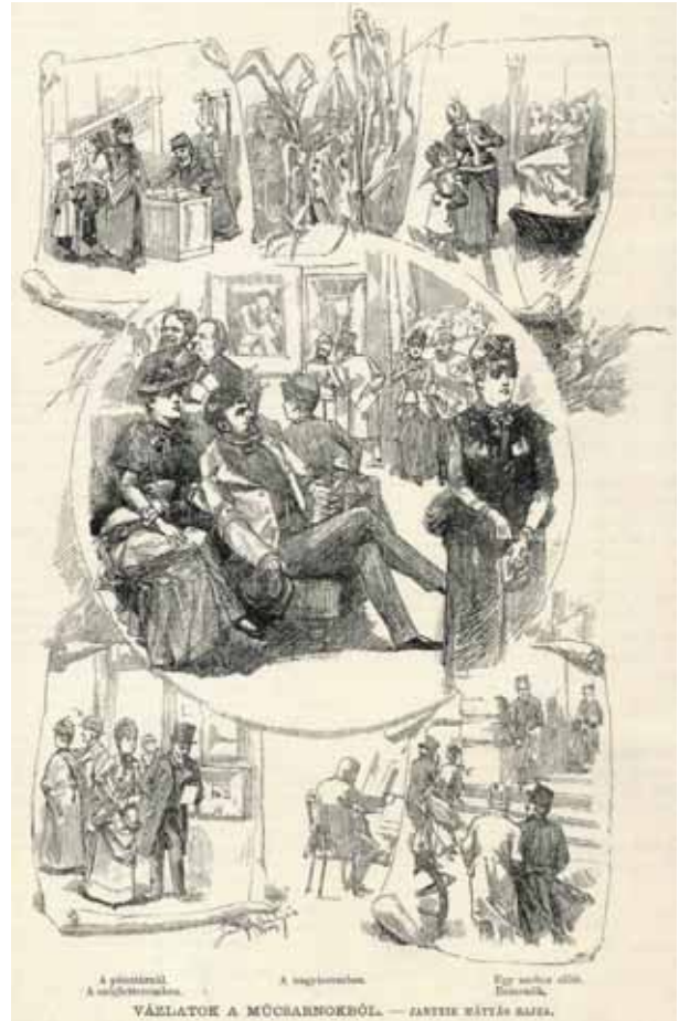
6. Jantyk Mátyás: Vázlatok a Műcsarnokból Vasárnapi Ujság , 33. 1886. november 14. 46. sz. 74o.

Böhm Pál és Mészöly Géza sok kis képpel szerepelt. Így a kezdőknek, a fiataloknak több lehetőség volt arra, hogy felhívják magukra a figyelmet, és a sajtó – jobb híján – róluk írt. Közük volt Greguss Imre, Aggházy Gyula, Spányi Béla, Feszty Árpád és Paczka Ferenc. Bár az 1870-es évek művészi szemlélete még a hagyományos műfaji hierarchia szerint rangsorolta a képeket, a történeti témákat helyezve a csúcsra, a jobb szemű kritikusok, mint például Hevesi Lajos, 18 észrevették, hogy a tájképfestésben megkapóan új munkák születtek. Felfedezték a hangulati tájat mint új jelenséget, amelynek a legjelentősebb képviselője, Mednyánszky László két képpel is szerepelt ekkor, és idetartozott a legtöbb fiatal